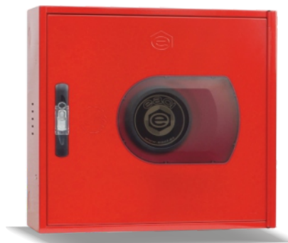
Mod. VERSAL R