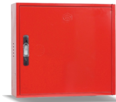
Mod. VERSAL C