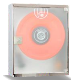
Mod. 690 PEI Mod. 690 PEIT45