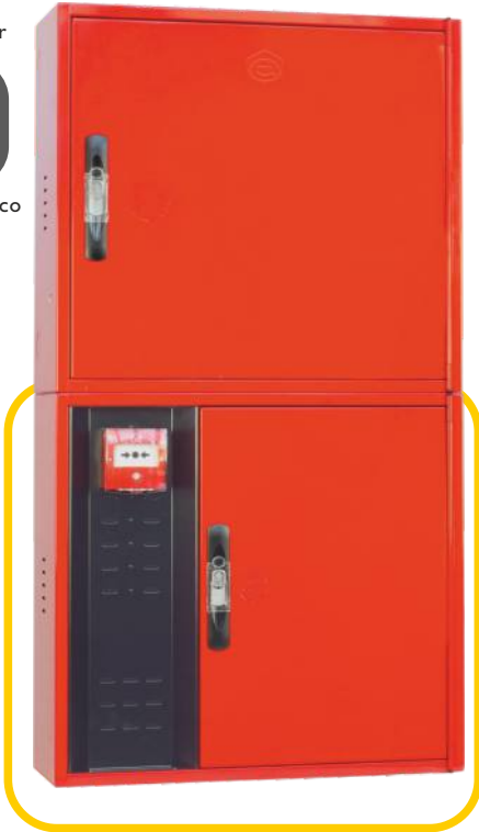
Ref. M VERSALC Configuración Vertical