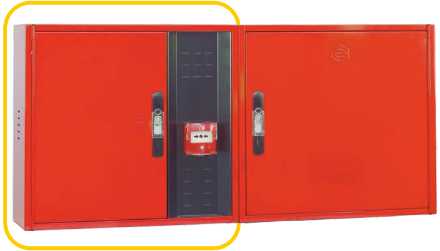
Ref. M VERSALC Configuración Horizontal