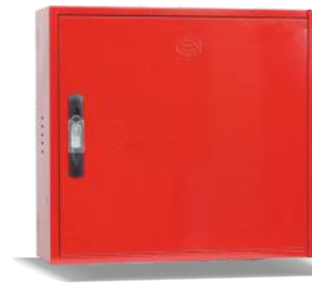
Mod. VERSAL C