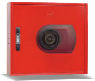
Mod. VERSAL R