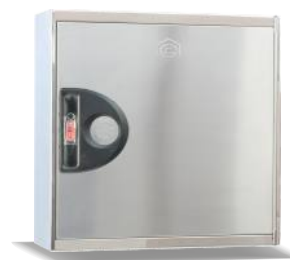
Mod. L20 IN