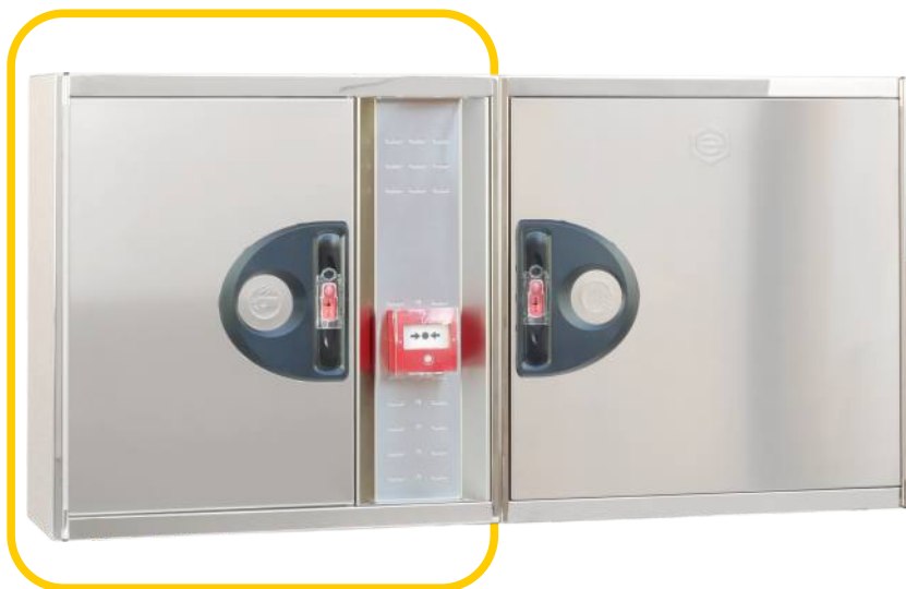
Ref. MTL20IN Configuración Horizontal