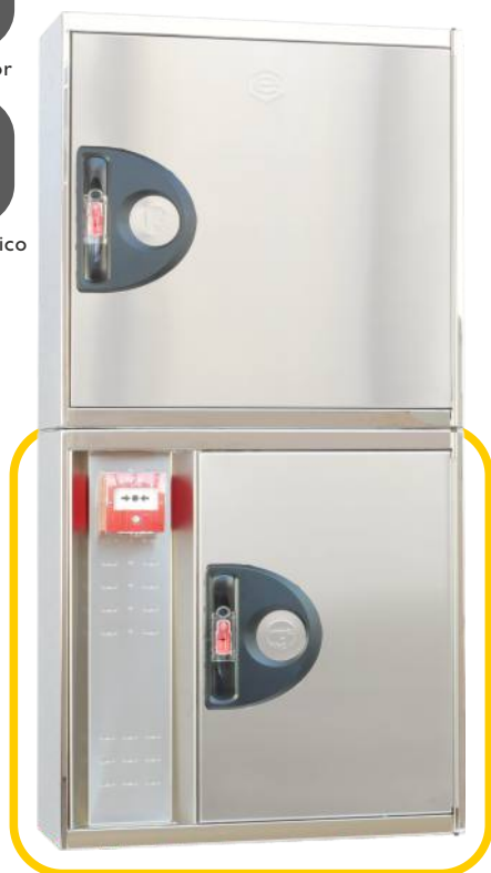
Ref. MTL20IN Configuración Vertical