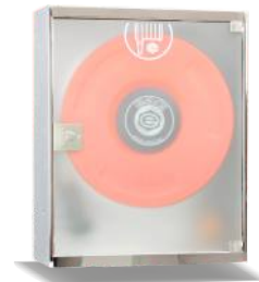
Mod. 690 PEI Mod. 690 PEIT45