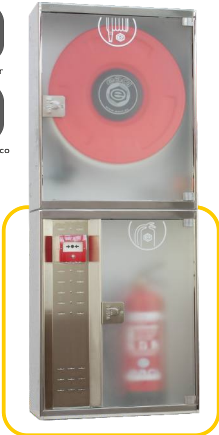
Ref. MT690PEI Configuración Vertical