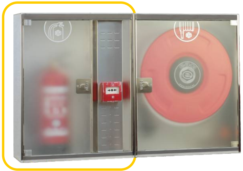
Ref. MT690PEI Configuración Horizontal