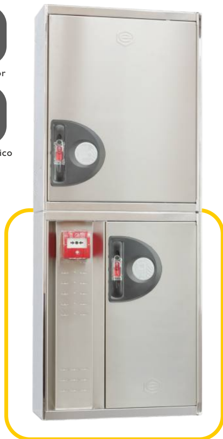
Ref. MT690CI Configuración Vertical