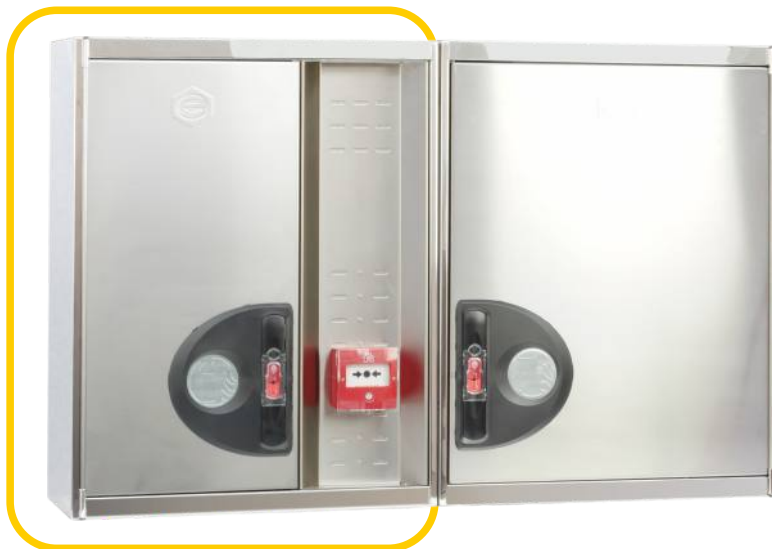
Ref. MT690CI Configuración Horizontal