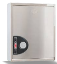
Mod. 690 CI Mod. 690 CIT45

DIMENSIONES DEL HUECO PARA INSTALACIÓN EMPOTRAMIENTO