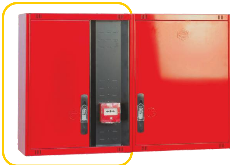
Ref. MT530C Configuración Horizontal