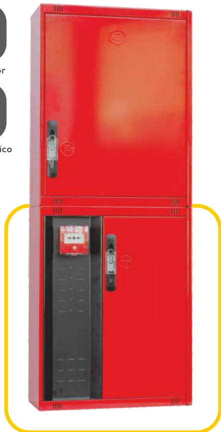
Ref. MT530C Configuración Vertical