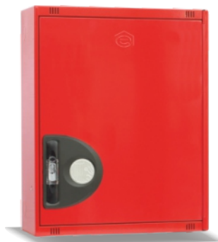
Mod. 690 C Mod. 690 CT45