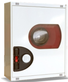
Mod. 690 R Mod. 690 RT45